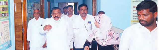
మౌలిక వసతులు అందుబాటులో ఉండాలని తెలిపారు ప్రభుత్వ ఆసుపత్రిలపై ఆధారపడుతున్న ప్రజలకు మెరుగైన వైద్య సేవలు అందించడం ప్రతి ఉద్దేశ్యంగా భావించాలి తెలిపారు అదేవిధంగా ఆస్పత్రి పరిసర ప్రాంతాల్లో పరిశుభ్రంగా ఉంచుకోవాలని ఆదేశించారు రోగుల సమస్యలను శ్రద్ధగా

ప్రభుత్వ వైద్యశాలలో సంబంధిత వైద్యులను అందుబాటులో ఉండి ప్రజలకు వైద్య సేవలు అందించేలా ఉండాలని డోన్ ఎమ్మెల్యే కోట్ల జై సూర్య ప్రకాష్ రెడ్డి అన్నారు. గురువారం ప్రభుత్వ ఆసుపత్రి ప్రాథమిక ఆరోగ్య కేంద్రాలను ఆయన ఆకస్మిక తనిఖీ చేశారు ఈ సందర్భంగా ఎమ్మెల్యే ఎమ్మెల్యే కోట్ల మాట్లాడుతూ ఆసుపత్రిలో ప్రజలకు ఎలాంటి అసౌకర్యం కలగకుండా చూడాలని వైద్య అధికారులకు సూచించారు అత్యవసర మందులు పరీక్ష నడుపాలింకా ఇతర