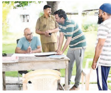
సమర్థవంతంగా పనిచేయగలిగేలా సూచించారు. అంతకు ముందు 7వ శానిటేషన్ డివిజన్లోని ఆశోకనగర్ ప్రాంతంలో మున్సిపల్ నీటి నాయకులకు కొత్త విషయం కాదు. ముఖ్యంగా జగన్మోహన్ రెడ్డి మొదలకొని రాష్ట్ర వ్యాప్తంగా ఉన్న వారి నాయకులు, కార్యకర్తలు, పేదీయం బాధ్యత వరకు అందరికీ ఒకే అవకాశం అబద్ధాలను పడేపడే ప్రచారం చేసి ప్రజలను